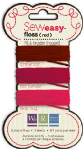
フロスレッド Item # 71062-2 本体価格300円 (税込315円)