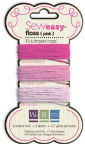
フロスピンク Item # 71063-9 本体価格300円 (税込315円)