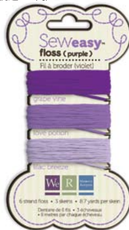
フロスパープル Item # 71067-7 本体価格300円 (税込315円)