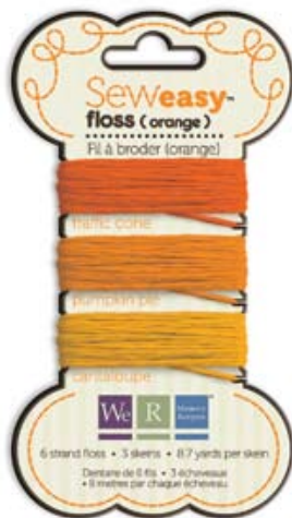
フロスオレンジ Item # 71070-7 本体価格300円 (税込315円)