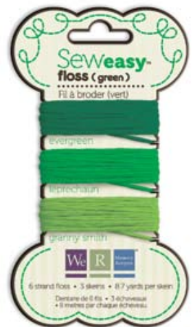
フロスグリーン Item # 71065-3 本体価格300円 (税込315円)