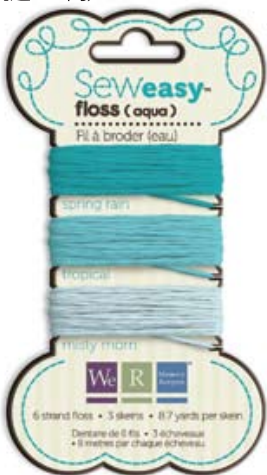
フロスアクア Item # 71071-4 本体価格300円 (税込315円)