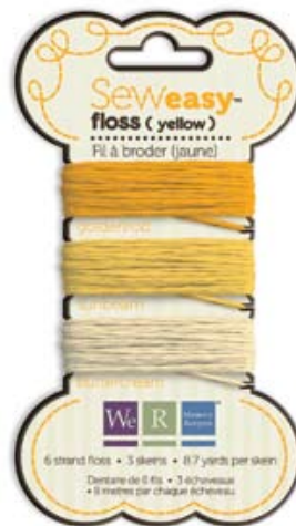
フロスイエロー Item # 71064-6 本体価格300円 (税込315円)