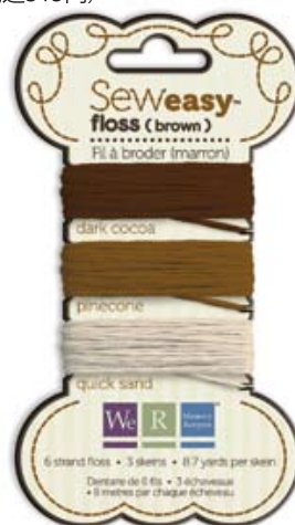
フロスブラウン Item # 71068-4 本体価格300円 (税込315円)