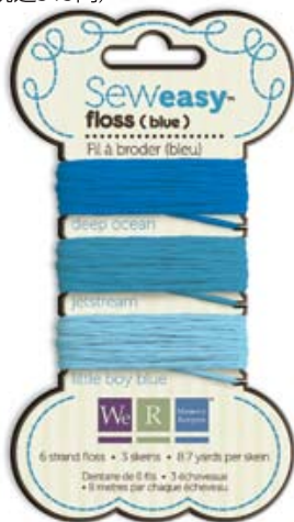
フロスブルー Item # 71066-0 本体価格300円 (税込315円)